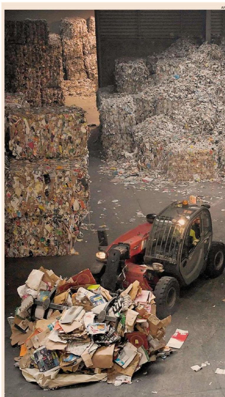
Economia circolare. Appello delle imprese al Governo per sbloccare il riciclo