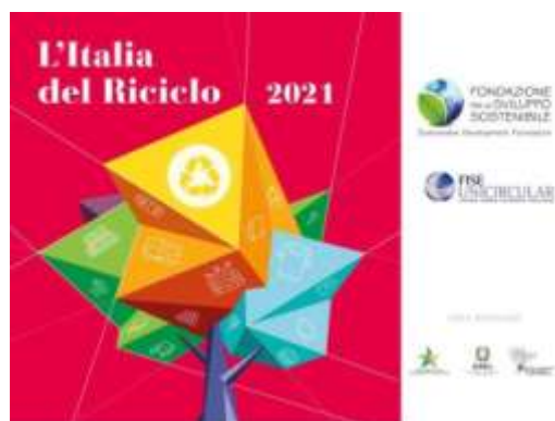
L'Italia del riciclo 2021

"Per una reale transizione ecologica servono però incentivi per i prodotti riciclati"