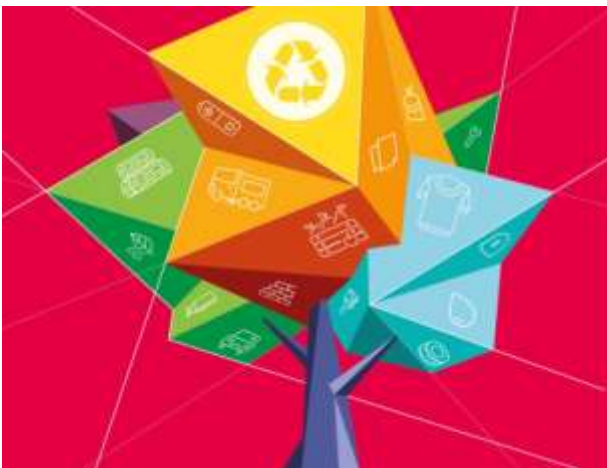
Italia del riciclo 2021